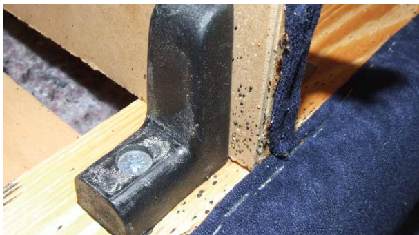
Typische Bettwanzenspuren am Bett