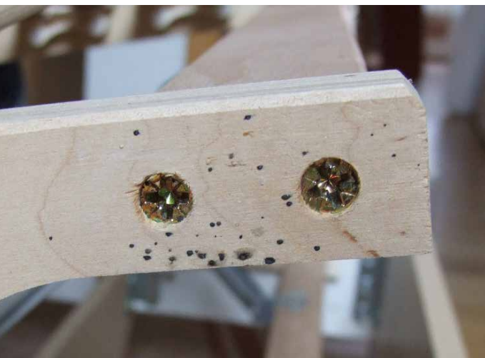
Bettwanzenkot am Lattenrost

Ein professioneller Schädlingsbekämpfer ist in der Regel Mitglied einer Berufsvereinigung wie dem Deutschen Schädlingsbekämpfer-Verband e.V. (DSV) oder dem Verein zur Förderung ökologischer Schädlingsbekämpfung (VföS). Vor der Bekämpfungsmaßnahme führt er eine Vor-Ort-Begleichung durch und stellt eine eindeutige Diagnose. Er gibt Ihnen Auskunft zur Lebensweise der Bettwanzen und bereitet Sie ausführlich auf die Bekämpfung vor. Ein kompetenter Schädlingsbekämpfer verspricht Ihnen nicht, dass der Befall mit einer Bekämpfung beseitigt ist.