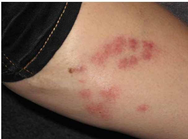
Bettwanzenstiche am Bein