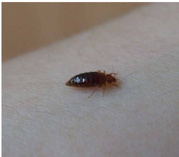
Bettwanze beim Blutsaugen

Die Wahrscheinlichkeit, sich Bettwanzen mitzunehmen, hängt in erster Linie von der Stärke des Befalls und der Dauer des Aufenthalts vor Ort ab.