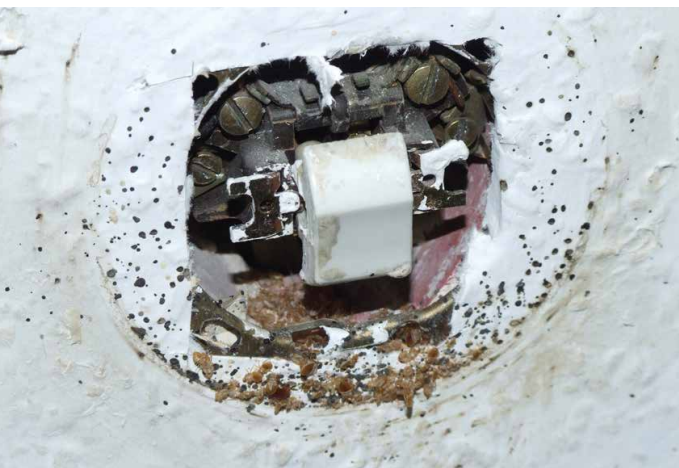
Bettwanzenversteck hinter einem Lichtschalter

Bewahren Sie Ruhe, wenn Sie einen Bettwanzenbefall in Ihrer Wohnung entdeckt haben. In keinem Fall dürfen Sie befallene Gegenstände unbehandelt aus der Wohnung entfernen, da Sie damit eine weitere Verbreitung der Tiere verursachen. Ein Umzug in eine andere Wohnung führt dazu, dass der Bettwanzenbefall in der alten Wohnung weiter bestehen bleibt und auch in die neue Wohnung getragen wird. Rufen Sie einen Schädlingsbekämpfer an und lassen Sie sich von ihm beraten. Vergleichen Sie die Beratung mit dieser Hinweisbroschüre und Aussagen anderer Schädlingsbekämpfer.